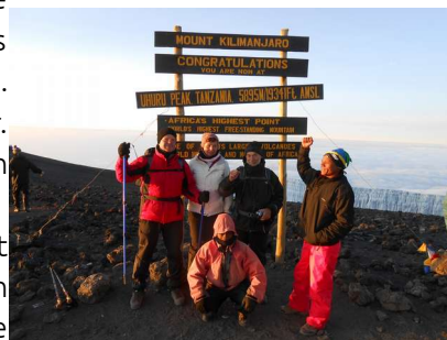
De top is bereikt