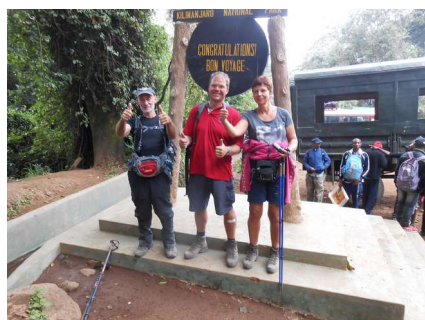
We hebben het volbracht, moe maar voldaan bij de finish