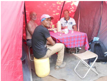
Ons 'restaurant' in de tent

Als we op het camp aankwamen stond de thee met koekjes of popcorn of nootjes voor ons klaar. Aardappels, rijst, groente, vlees, vis alles kwam voorbij en best wel lekker ook nog, met fruit toe.