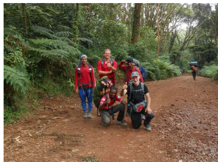
Bijna bij het eind, allemaal in bijna dezelfde kleur gekleed

Dit zou onze laatste nacht op de camping worden 'gelukkig'. Er was voor de verandering ook weer eens een schappelijke WC pot op het gat geplaatst. Ik was erg blij dat te zien, want op je hurken boven een gat is ook niet alles. We gingen weer vroeg naar bed want we waren weer bekaft. Het was gelukkig ook niet meer zo koud daar. We sliepen heel ontspannen die nacht want alle zorgen waren voorbij.