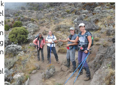
Dag 2 nog vol goede moed

Dag 3 : van Shira camp naar Baranco camp.