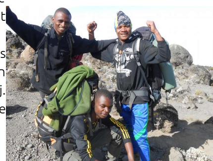
Dit is de laatste foto van de gidsen, die ons zo goed begeleid hebben.