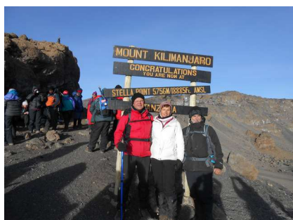
Op de terugweg nog even op de foto bij Stella point

Het vroor best wel op de top, dus lang bleven we er niet en iedereen wilde foto's maken bij het bord. We gingen weer terug naar Stella point om daar nog wat foto's te maken, want nu was het daar ook licht.